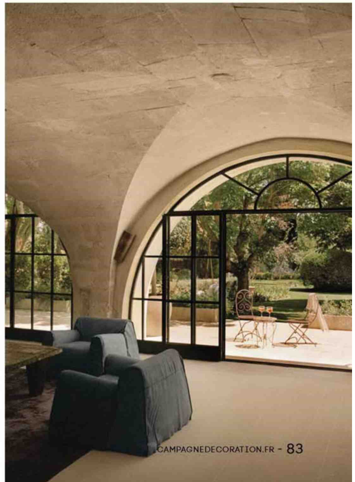
CAMPAGNEDECORATION.FR - 83